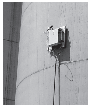
Testfahrt des Roboters am Tank.

Die Wegplanung, welche durch Benutzereingaben beeinflusst werden kann, wird basierend auf einer Rasterkarte des Tanks durchgeführt. Die Wegplanung ist speziell für diese Anwendung entwickelt worden, wodurch sie sehr effizient ausgeführt werden kann. Der Regler generiert basierend auf dem geplanten Weg, die optimalen Steuersignale, um die Fehler